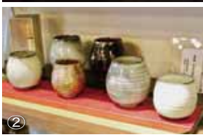
②高取焼の茶器技術から生まれたヒット商品「香るカップ」。③東峰村と東京の店舗を合わせ18名が在籍。