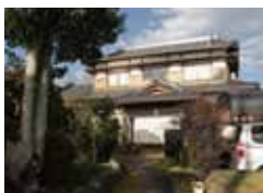
楽心堂本舗 株式会社

住所：田川郡福智町金田 946 Tel：0947・22・7288 http://www.rakushindo.jp/