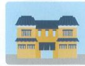
個人教授所 (生け花、茶道など)