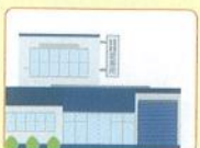
別経営の加盟店・ 子会社などの事業所