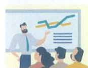
社員研修センター