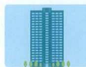
本所・本社・本店