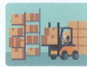
従業者のいる倉庫