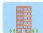
支所・支社・支店