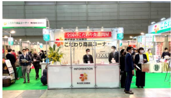
前回のこだわり商品コーナーの様子

こだわり商品コーナーは、上手く活用すれば非常に効果的であることから、前回は 出展案内開始から10分で小間が埋まり、キャンセル待ちが出るほどの人気 を誇る。