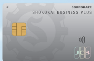
一般カード 年会費：1,375円(税込)