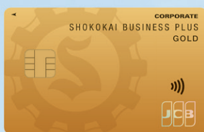
ゴールドカード 年会費：11,000円(税込)